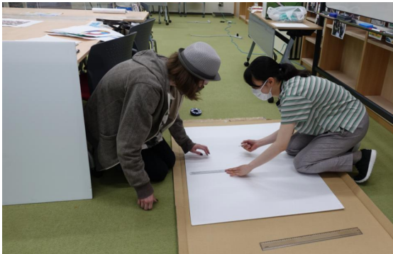
↑ 第五回作業の様子