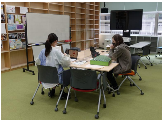
← 第三回授業の様子（対面・オンライン併用）