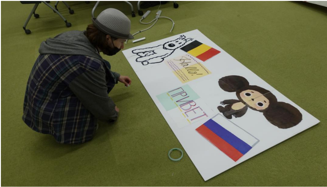
第八回：パネルの掲示、全体の振り返り